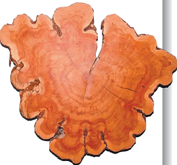
Holz ist die große Leidenschaft der Mitarbeiter der Firmengruppe Auer.